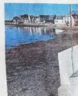
Les travaux vont bon train dans la réflexion de la passerelle à

Conseil municipal très bref avec un seul dossier à l'ordre du jour : le contrat d'apprentissage mis en place à l'école l'ont très scolaire.