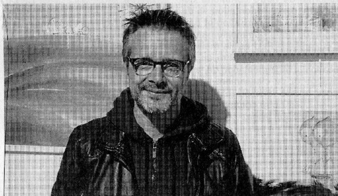
Sillousoune expose jusqu'à fin juillet.

L'espace Terre marine accueille jusqu'à la fin juillet le peintre crozonnais Sillousoune. C'est l'occasion de se promener dans le monde merveilleux de ce peintre, coach artistique, ou graphiste à ses heures. Dans cet espace qu'il s'est approprié, l'exposition se visite en trois étapes.