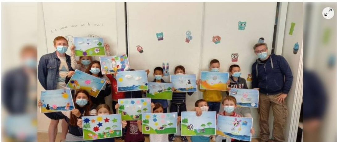
Les enfants ont pu réaliser des dessins inspirés par les « bestioles » de l'artiste Sillousoune.