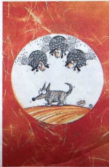
Moutons ou poissons volants de l'artiste Sillousoune.

Jusqu'au 28 avril , au magasin l'Éclat de verre, 57, rue de Bénodet Quimper. Du mardi au samedi de 9 h 30 à 13 h 30 et de 14 h 30 à 18 h 30. Entrée libre.