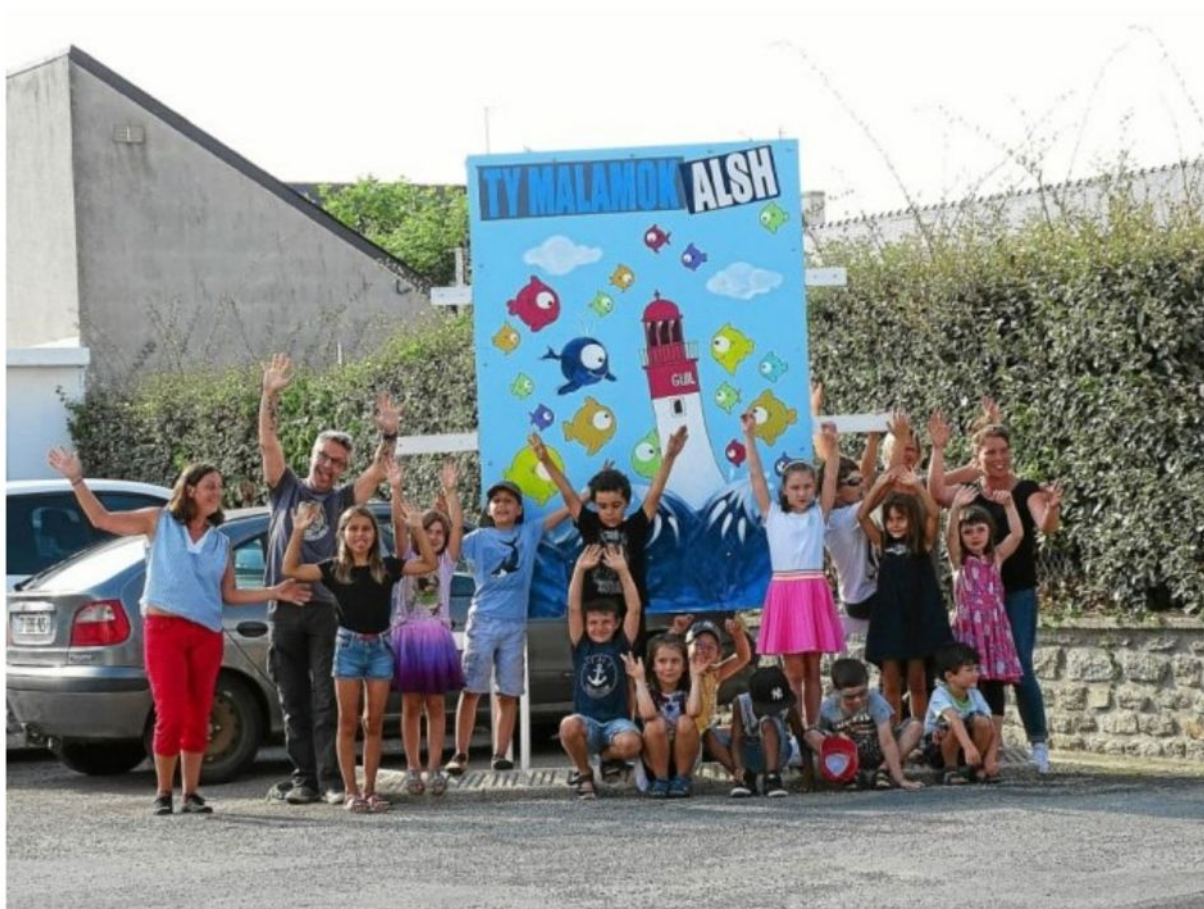
Enfants, animatrice, directrice, et artistes joyeux, devant le nouveau panneau du Ty Malamok.