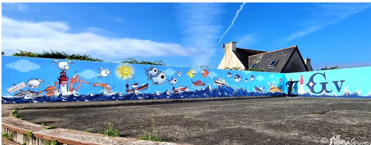
Très grande fresque + mur peint Détails ci-dessous grande fresque