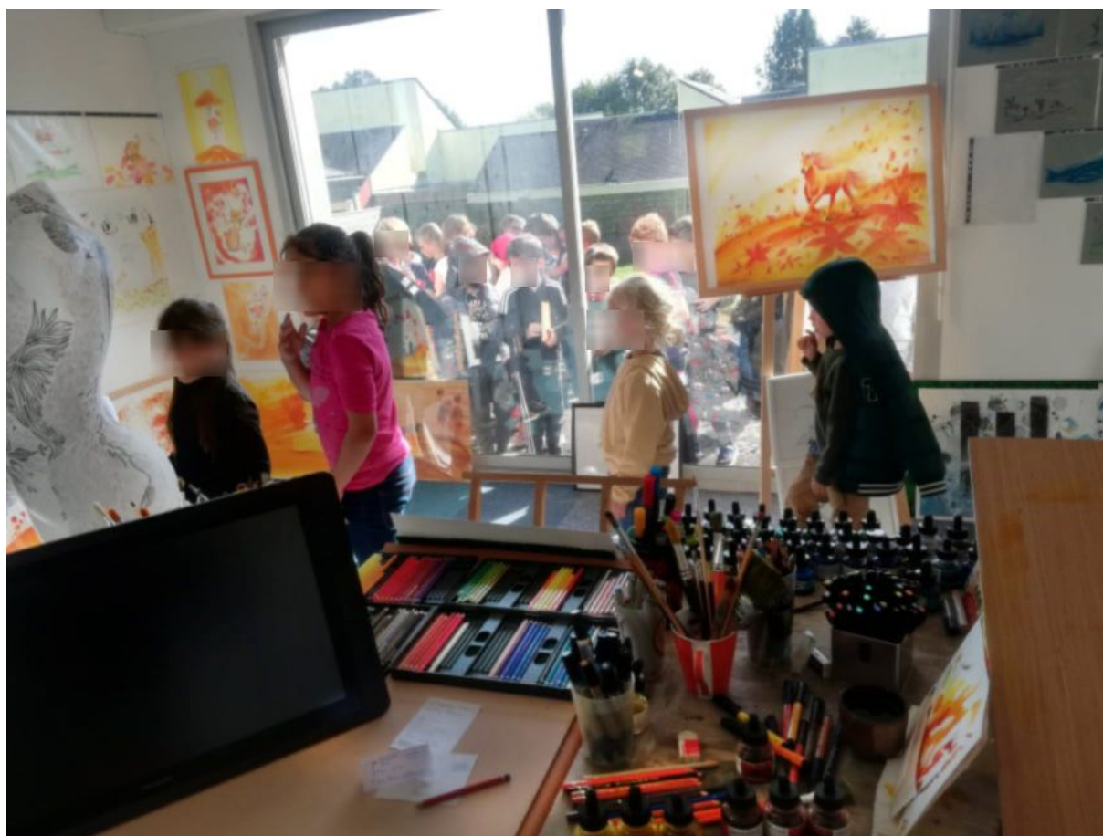
visite de l'atelier de plusieurs groupes (écoles, centre de loisirs, IME, collège)

Chasse aux trésors 15 livres dédiés à gagner, en partenariat avec l'union des commerçants