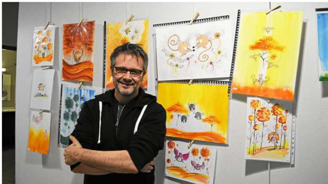
Sillousoune propose également divers ateliers auprès de groupes d'enfants.

Le dessinateur Sillousoune expose à l'Alizé jusqu'au lundi 27 mars. Le vernissage de l'exposition, qui propose des œuvres colorées et animales, s'est déroulé vendredi soir.