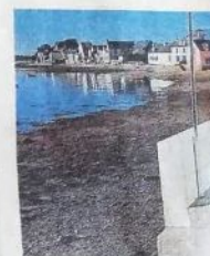
Les travaux vont bon train de la réfection de la passerelle

Conseil municipal très bref avec un seul dossier à l'ordre du jour : le contrat d'apprentissage mis en place à l'école lors de la rentrée scolaire.