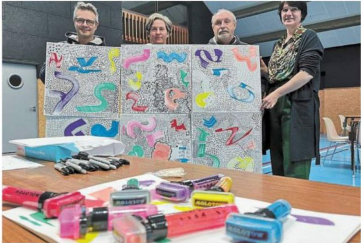
La fresque collective de La Trinité-Porhoët prend forme.

La fresque collective se dévoile lors d'un vernissage