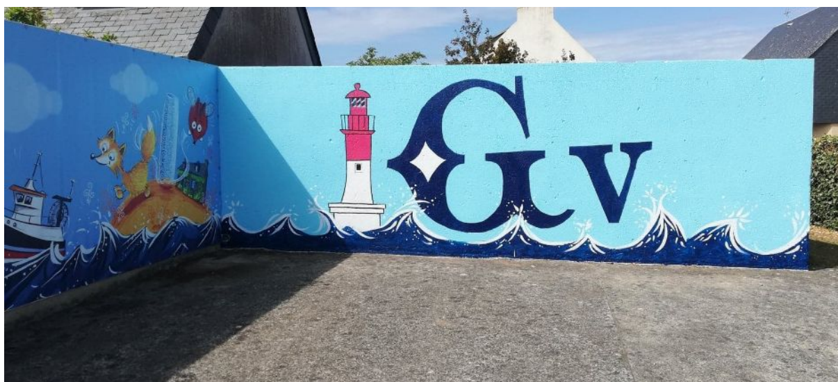
Réalisation du panneau d'entrée du centre de loisirs (ALSH TY MALAMOK) par les enfants