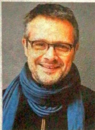
Sillousoune expose au Ceili ses œuvres originales.