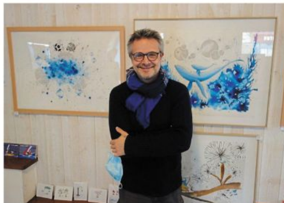
Le public peut rencontrer l'artiste Sillousoune et découvrir ses œuvres dans l'ancien office de tourisme.

Sillousoune est connu pour ses dessins et livres pour enfants. La première série de dessins est celle des Bestioles , créée en 2012. Elle a été suivie par une collection de livres, les P'tites bestioles , publiée par les éditions Beluga depuis 2017. Il y a deux ans, Sillousoune a débuté une collabora-