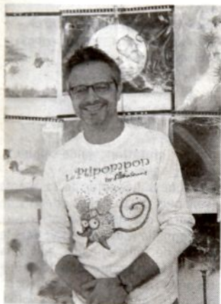
Sillousoune expose ses dessins en mairie durant une semaine.

Il porte un nom aussi décalé que ses œuvres. « Sillousoune » expose ses dessins pour la première fois à Quiberon, toute cette semaine, en mairie. Ce Lorientais qui vit à Crozon découvre la presqu'île avec enthousiasme et bonne humeur, exactement les ingrédients qu'il met dans son travail de dessinateur. « J'ai commencé tout jeune à