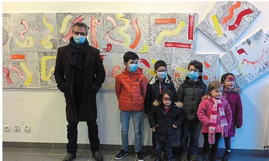
Le principe : on ne peut distinguer les créations des enfants de celles des jeunes ou des aînés.

Exposé à L'Arthémuse jusqu'au début du mois de janvier, l'ensemble des toiles a fait l'objet d'un vernissage en présence des élus. « Quand on a proposé cette résidence à Sillousoune, le principe était d'entrer en