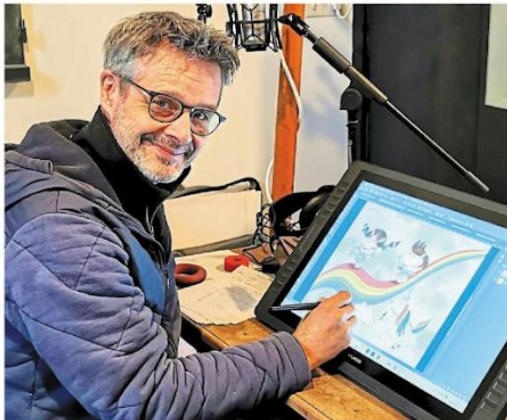
Sillousoune, artiste en résidence dans la commune, propose aux habitants, jeunes et moins jeunes, de réaliser avec lui une fresque collective.

L'illustrateur a terminé les dessins du premier livre qui se nommera : Pour