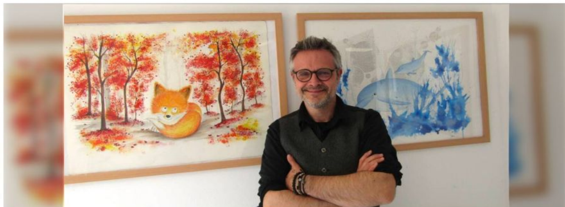
Sillousoune donne des ailes à l'imaginaire. | OUEST-FRANCE