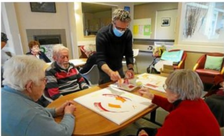
Intervention de Sillousoune à l'Ehpad Flora-Tristan.

Cette fresque, basée sur l'univers des livres, intégrant la nature, est composée d'une vingtaine de toiles. Elles ont été réalisées sur la période du 30 novembre au 4 décembre par les habitants du territoire, de l'accueil de loisirs de Briec, l'Artothèque, le Centre social Ty Glazik, l'Institut médico-éducatif (IME), les écoles et collèges de Briec et d'Edern, l'Ehpad Flora-Tristan et l'Arthémuse. Ce vendredi 3 décembre, c'était au tour d'une dizaine de résidents de l'Ehpad de participer à la réalisation de trois toiles destinées à rejoindre la fresque intergénérationnelle, sous l'œil bienveillant de l'artiste.