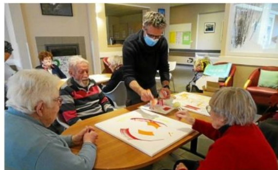
Intervention de Sillousoune à l'Ehpad Flora-Tristan.