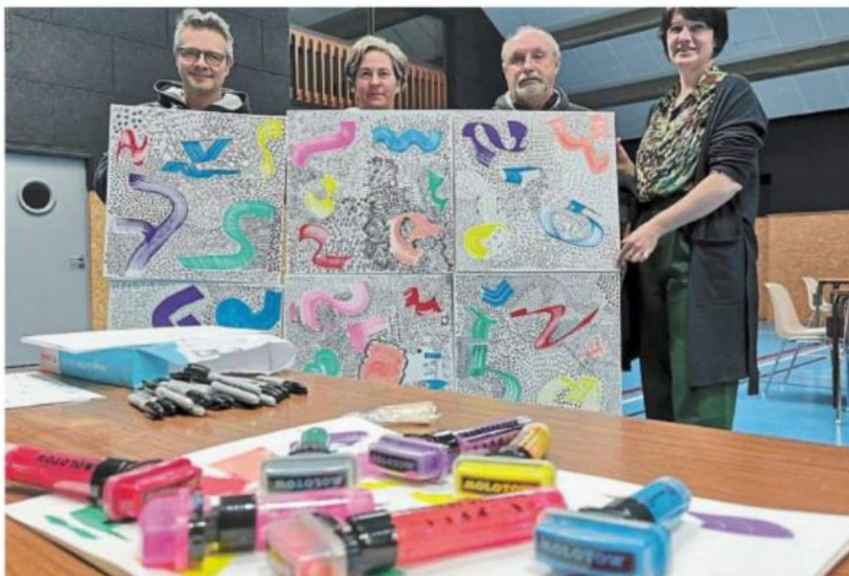
La fresque collective de La Trinité-Porhoët prend forme.

La fresque collective se dévoile lors d'un vernissage