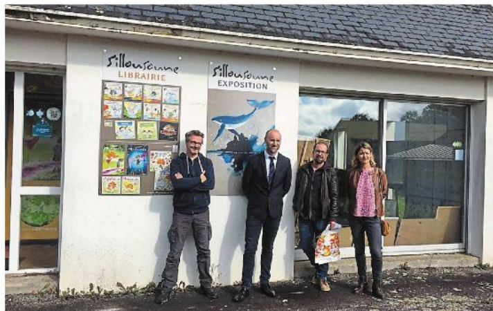
La « maison de l'instituteur » se mue en résidence d'artiste.

En partenariat avec la municipalité et avec les associations locales, l'artiste réalisera, durant cette période, des créations en lien avec l'atmosphère du lieu. Mais son emploi du temps est déjà bien chargé : outre la gestion de la maison qui devient lieu d'exposition et de vente, il interviendra également dans les écoles afin