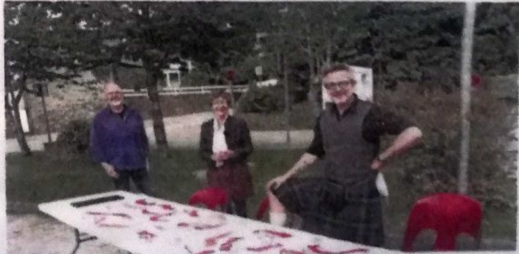
Une soixantaine de personnes ont participé à la réalisation de la fresque.

risme 2, rue du Vieux Port. Il y présente son travail et ses livres jeunesse.